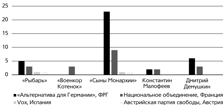
Рис. 2. Удельный вес упоминаний западноевропейских право-популистских партий в ТГ-каналах российских правых, 2025 г., %